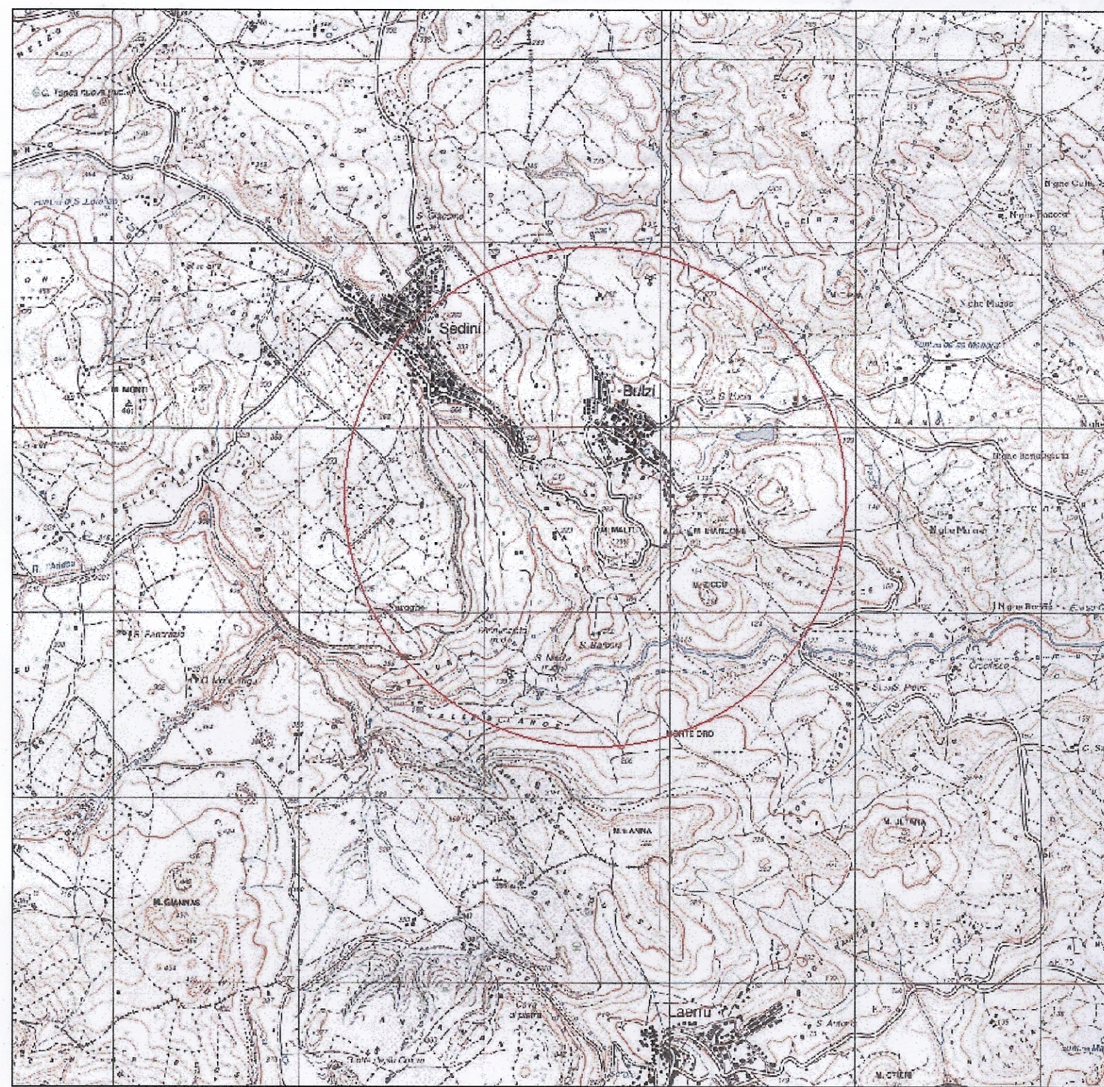
Starlio IGM 25:000 - Foglio 421110 - Bulzi